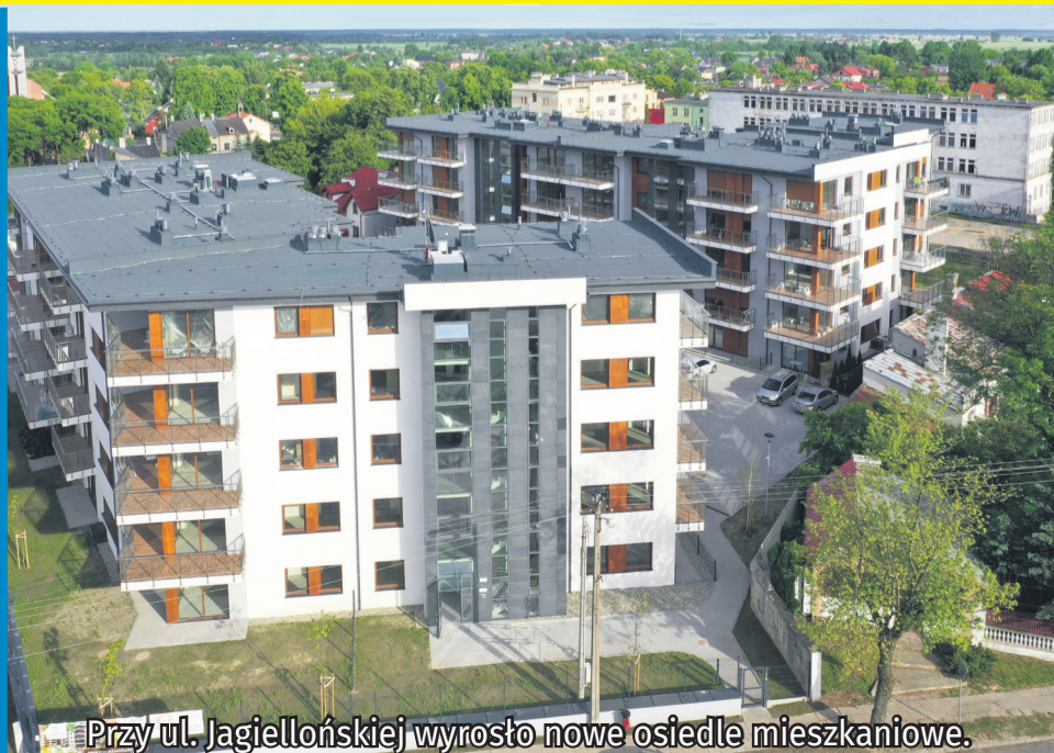
Przy ul. Jagiellońskiej wyrosło nowe osiedle mieszkaniowe.

Szeroką bazę mieszkaniową w Piotrkowie dopełniają ciekawe oferty kupna domków jednorodzinnych. Takie osiedle wyrosło m.in. przy ulicy Michałowskiej, a w planach jest przy ul. Zycziwej.