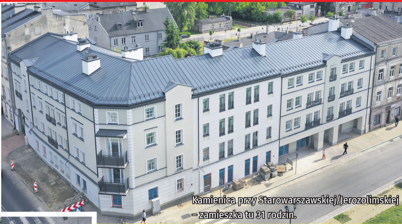
Kamienica przy Starowarszawskiej/Jerozolimskiej – zamieszka tu 31 rodzin.

Na tym jednak nie koniec. Miasto już przygotowuje się do kolejnych inwestycji mieszkaniowych. Obecnie rozważane są lokalizacje następnych budynków. Jeden z nich może znaleźć się w okolicy budynku stawianego u zbiegu ulic Starowarszawskiej i Jerozolimskiej.