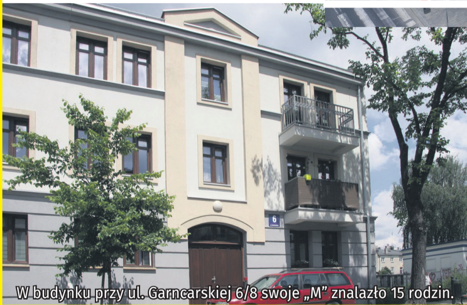
W budynku przy ul. Garncarskiej 6/8 swoje „M” znalazło 15 rodzin.