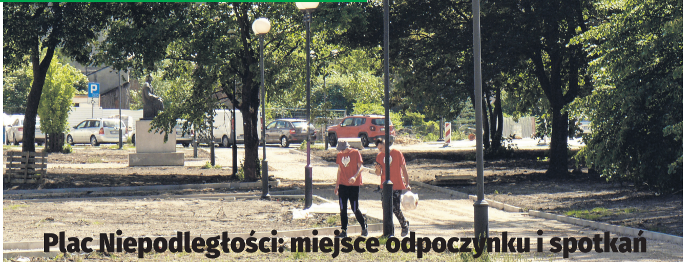
Plac Niepodległości: miejsce odpoczynku i spotkań

Koszt modernizacji to blisko 2,8 mln zł, jednak miasto z budżetu wyda dużo mniej pieniędzy. To za sprawą unijnego dofinansowania pozyskanego na projekt „Młode Stare Miasto”, którego częścią jest przebudowa placu Niepodległości.