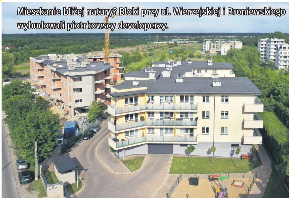
Mieszkanie bliżej natury? Bloki przy ul. Wierzejskiej i Broniewskiego wybudowali piotrkowscy developerzy.